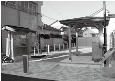
▲小松地区市街地基盤整備事業

市では、皆さんに市の財政状況を知っていただくため、年に2回、各会計の執行状況などを公表しています。今回は、平成25年度上半期（4月1日～9月30日）の財政状況について、お知らせします。