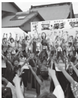
▲昨年のダンス夏彩祭

西条商工会議所東予支所内 夏彩祭 in 壬生川2008実 行委員会事務局 TEL0898-64-5795