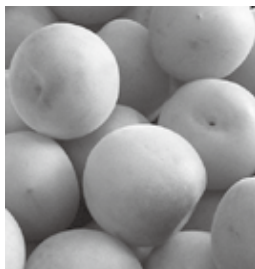
今月号の「ふるさと産品通信」(21ページ掲載)では「梅」を紹介しています。