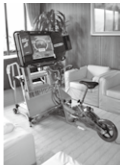
▲自転車シミュレーター

■定員 各30人 ■申込期限 開催日の7日前 ■問合せ 市庁舎本館危機管理課 交通治安係 TEL0897-52-1284