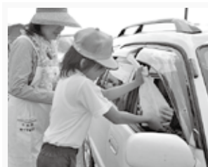
交通安全の花を咲かせてください！

らに話す思いにはひとしおのものがありません。「ドライバーの方にいつも安全運転を意識してもらえよう願いながらしおりを作りました」「自分たちも事故に遭わないよう、道路は左右を確認し手を上げて横断歩道を渡ります」などと話してくれた児童たち。椿の苗木を育てることを通して生命の大切さを学ぶとともに、自らの命を守るということ、今一度考える機会となったのではないのでしょうか。