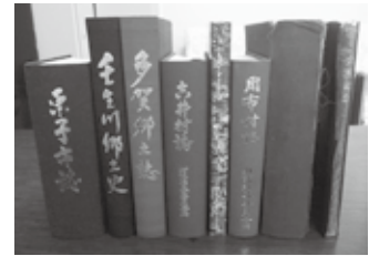
東予地域の郷土誌

各地区で編綴（へんてつ）された村誌や郷土誌からは、先人の足跡や郷土の歴史を後世に残し、その業績を将来の指針として活かそうとした各地域の皆さんの熱意が伝わってきます。