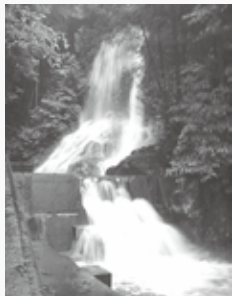
夏でも涼やか「横谷の滝」

農山村を中心とした簡易水道施設の整備が、全国で活発となった昭和20年代後半。旧丹原町でも、昭和29年に田滝や馬場地区で簡易水道が完成したのを契機として、町内各地で急速に水道施設の整備が進みました。