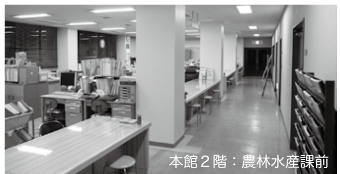
本館 2階：農林水産課前