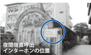
夜間宿直呼出インターホンの位置