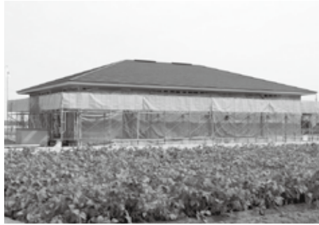
▲コミュニティ施設整備事業（新市集会所）