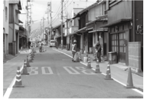
▲丹原地区市街地盤整備事業