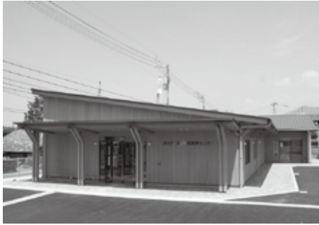
▲休日夜間急患センター整備事業