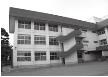
▲小中学校校舎等耐震改修事業（小松小学校）

市では、皆さんに市の財政状況を知っていただくため、年に2回、各会計の執行状況などを公表しています。今回は、平成24年度上半期（4月1日～9月30日）の財政状況についてお知らせします。