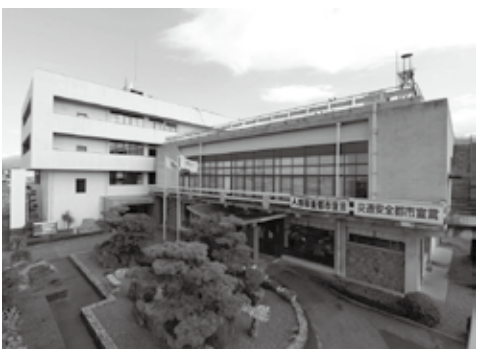
▲本年度から改修予定の小松総合支所手前の別館は、奥側の本館改修が終了後に、取り壊し、駐車場にする予定です。