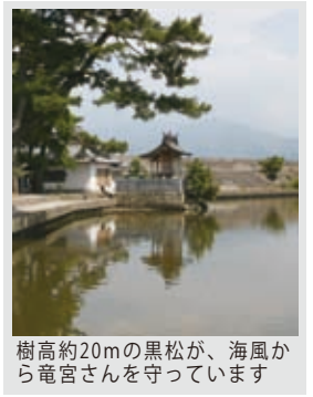
樹高約20mの黒松が、海風から竜宮さんを守っています

た。そんな中、地元の禎瑞小学校では「親子ふれあい交流体験事業」として、全校児童がこのお川狩りに参加しています。竜宮さんに見守られながら、今年も子どもたちが大きな投網の花を咲かせてくれることでしょう。