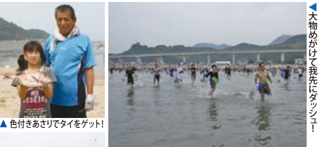
▲色付きあさりでタイをゲット!