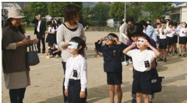
▲曇り空であきらめかけたところ、白差しが