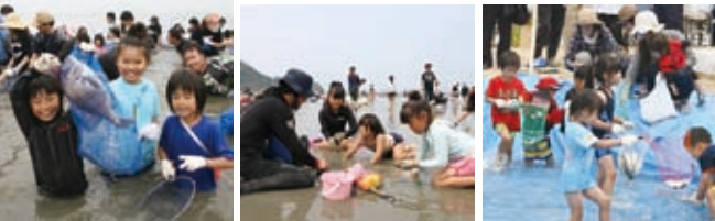
▲大物めがけて我先にタッシュ!

開始の合図で参加者が一斉に河原津海岸を海に駆け出す恒例の「立て干し網」。12回目の今回は約6,000人の水しぶきで大迫力。大きなハマチを捕まえて歓声を上げる若者、色付きアサリを見つけてタイをプレゼントされた女の子、仮設プールでアジを追いかける小さな子どもたち。誰にも笑顔があふれていました。