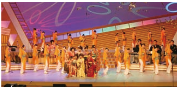
▲市民の皆さんの踊りも決まりました!