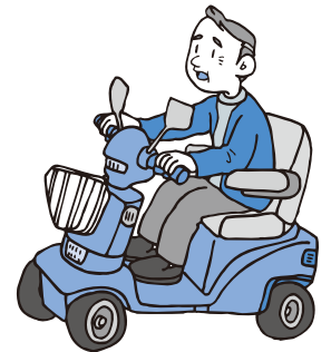
▲一般的な電動車いす