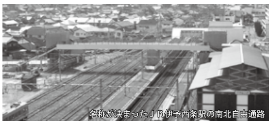
名称が決まったJR伊予西条駅の南北自由通路

命名者のお二人およびご応募してくださいました多くの方々にお礼申し上げます。今後、整備予定のJR壬生川駅「東西自由通路」の名称も募集する予定です。