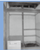
改修前 内装仕上 取除き後 (左写真)