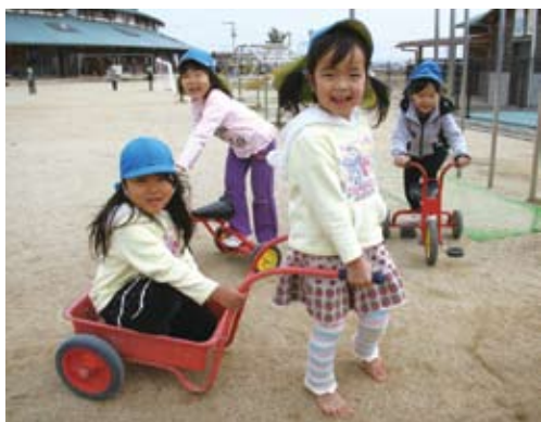
特別保育を実施するなど保育サービスの充実に努めている保育所