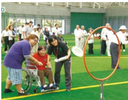
障害者と健常者がふれあいを通じて相互理解と関心を高め、障害者の社会参加を進めるふれあいの運動会