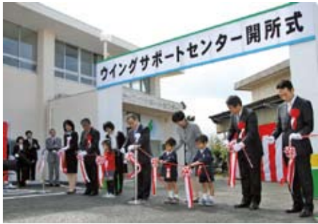
▲ウイングサポートセンター整備事業（11月1日開館）