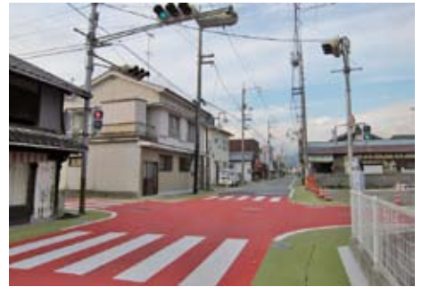
▲丹原地区市街地基盤整備事業