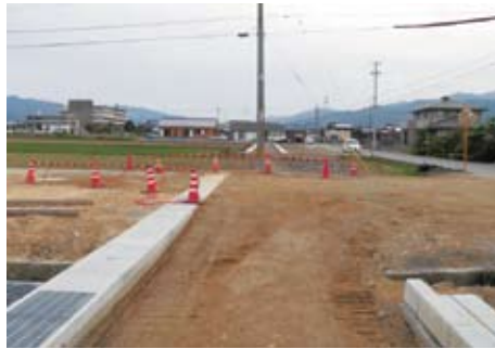
▲壬生川地区まちづくり基盤整備事業