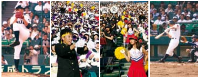
▶アルプススタンドは超満員