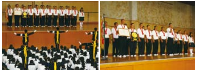
県大会優勝の興奮冷めやらぬ中、既に闘志は全国大会に向けていました。