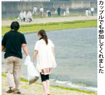
▲ カップルでも参加してくれました