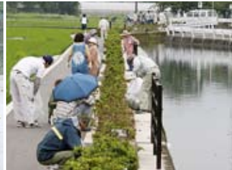
サラサラ川の下小川付近と明神木付近