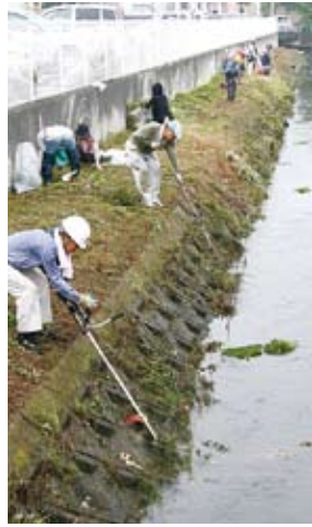
▲ 御舟川の横黒西付近

「西条市河川の清流を守る条例」において水質保全区域に指定されている、西条地区の4水系（新町川、新川、御舟川、馬淵川・サラサラ川）の一斉清掃が行われました。当日は途中で雨が強く降り出す、あいにくの天候となりましたが、周辺住民や市内企業の皆さんなど約1800人が参加し、河川周辺の除草やごみ拾いなどを行いました。収集されたごみは約42トンにも及び、参加者の皆さんはびしょ濡れになってしまいましたが、川辺は本当にきれいになりました。