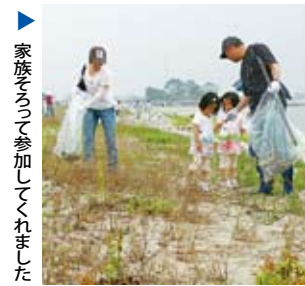
▲ 家族そろって参加してくれました