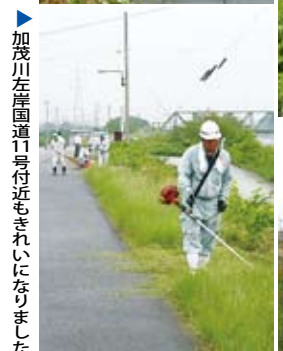
加茂川左岸國道11号付近もきれいになりました