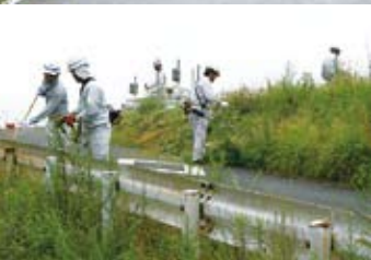
加茂川左岸古川付近も