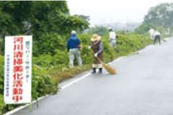
中山川左岸長野付近も