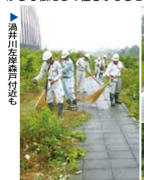
渦井川左岸森戸付近も

「クリーン愛媛運動」の主旨である、豊かな自然と風土に恵まれたふるさと愛媛の住みよい快適な環境を守るための清掃奉仕活動が実施されました。県建設業協会西条支部の皆さん約130人が、加茂川、中山川、渦井川堤防での除草作業やごみの回収などを行いました。これからも私たちの住むふるさとの美しい景観を守り続けたいものです。