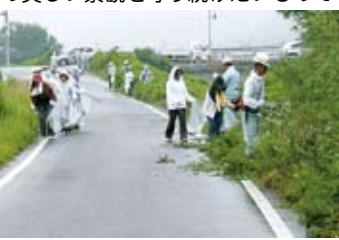
中山川左岸金比羅橋付近も