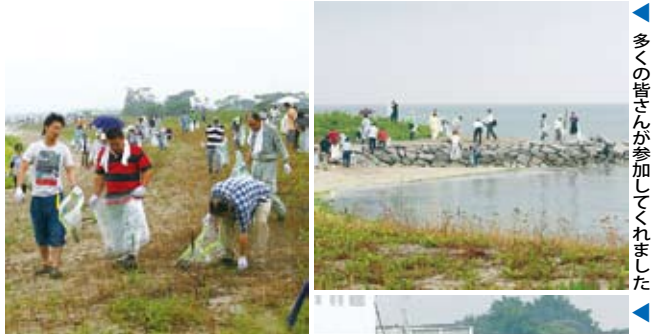
多くの皆さんが参加してくれました