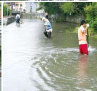
▲ 御舟川の朝日町付近