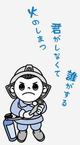
平成20年度全国統一防火標語