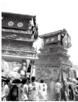
昨年開催の「四国の祭り2008」