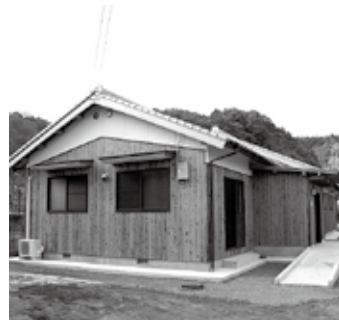
▲完成した徳能集会所