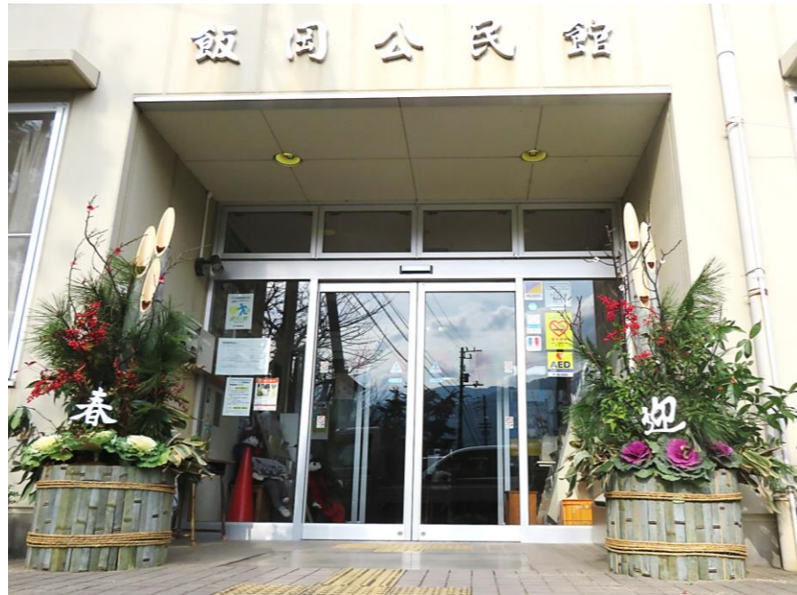
門松づくり有志のみなさん 立派な門松をありがとうございました。

飯岡校区人口 6,297人 (-3) 男 3,033人 (-8) 〒793-0010 西条市飯岡2171-2 女 3,264人 (+5) TEL:56-2118 FAX:53-9014 世帯数 3,012戸 (-5) E-mail:iioka-k@saijo-city.jp 令和5年11月30日現在 (前月比) 【QRコードから市内の公民館だよりがご覧になれます。】