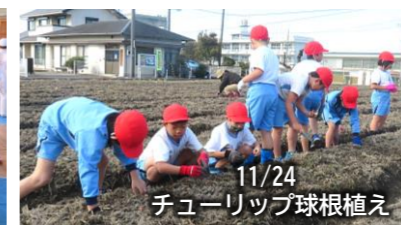
11/24 チューリップ球根植え