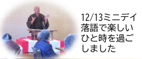
12/13ミニデイ 落語で楽しい ひと時を過ご しました