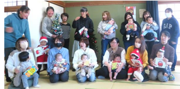
12/13子育て座談会 みんなでクリスマスパーティー☆