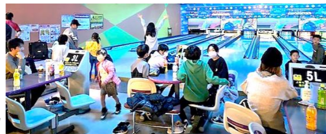
冬の恒例行事、家族みんなで楽しみました