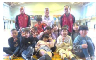
11/22 11/29 12/6 12/13 バドミントン