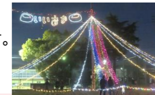
12/10(日) スポーツ少年団と空き缶拾い イルミネーションの設置 ステキな点灯式を、ありがとうございました!