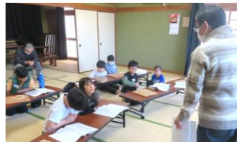
放課後子ども教室 11/25 12/9 将棋