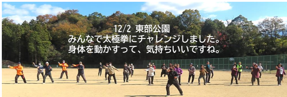
12/2 東部公園 みんなで太極拳にチャレンジしました。 身体を動かすって、気持ちいいですね。

日時：1月14日(日) 8:30～ 場所：飯岡小学校 南側の田んぼ 対象：一般(どなたでも参加できます) ※お正月しめ飾りは、1月12日(金)までに所定の場所に入れてください。 ①学習田の所定の位置 ②公民館駐輪場 ※危険ですので、しめかざりの針金・プラスチック類は必ず取り除いて下さい。子どもたちがケガをします! ※詳しくは【回覧】をご覧ください。