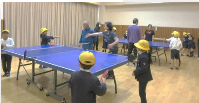
西条フレンドクラブさんの卓球に参加させていただきました。