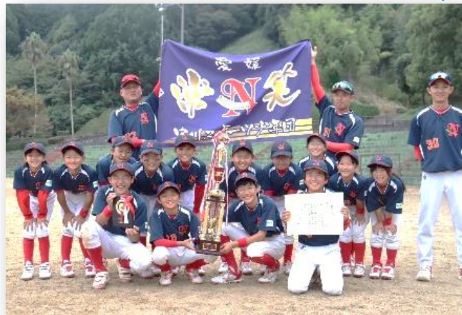
※中川スポーツ少年団は、丹原小学校と中川小学校の児童で結成されています。