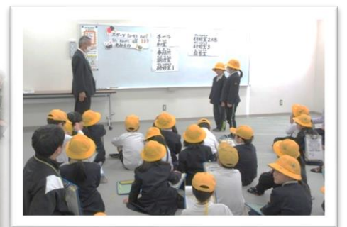
一生懸命メモを取る姿が印象的でした。