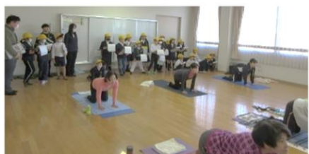
らくらくヨガさんのサークルを見学。 同じポーズをとって体験する児童も!