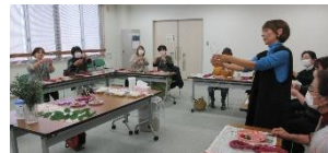
真剣な顔で、水引の形作り

参加者さんに自己紹介がてら最近の「ドキドキわくわく」エピソードを話していただき、それぞれのお話に皆さんが拍手👏。なんともアットホームな雰囲気の中で楽しみながら作ることができました。