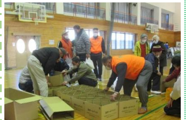
段ボールベッドを作っています。 (12/10 丹原西中体育館)