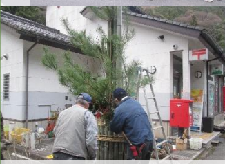
こんなもんでかまんかいの…