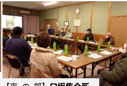
【夜の部】白坂集会所