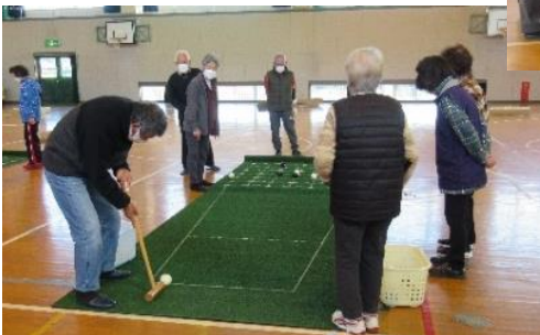
11月25日(土)国安小学校体育館で囲碁ボール大会が開かれ、各コートに分かれて試合をしました。皆さん和気あいあいとゲームを楽しんでいました。