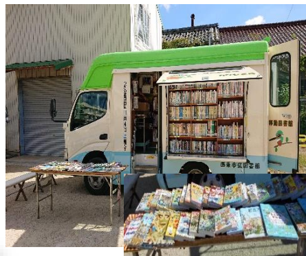
移動図書館カワセミ号