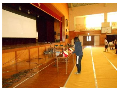
eスポーツ(太鼓の達人)