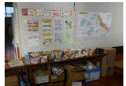
防災用品展示体験