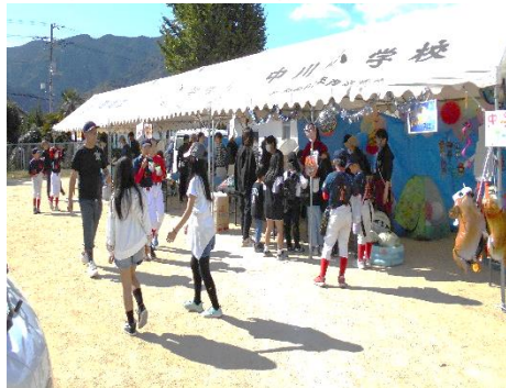
たくさんの人で賑わいました