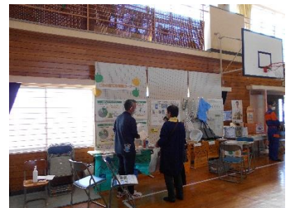
ごみの捨て方相談会