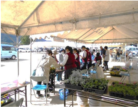
丹原高校 寄せ植え教室

10月22日(日) 晴天にめぐまれ、中川小学校体育館・グラウンドで中川地区文化祭が盛大に開催されました。