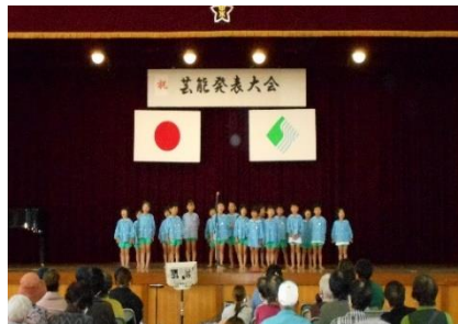
芸能発表もたくさんの人で会場が賑わいました