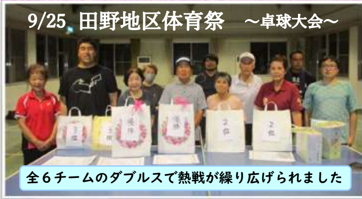
全6チームのダブルスで熱戦が繰り広げられました