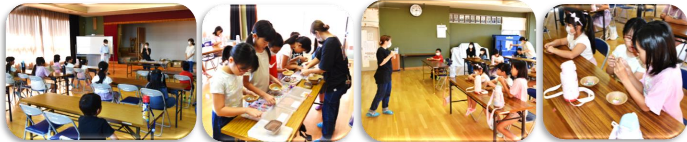
▲先生のご紹介後ビーズ選び実施。どのビーズも気に入って、材料を選ぶのは大変(^^); ▲説明を受けながら、それぞれ選んだお気に入りのビーズを組合せる。

9月24日(日)多賀地区青少年健全育成協議会による、ふれあい教室が多賀公民館にて実施されました。今回はビーズストラップづくりで、先生から指導を受けながら、様々な大きさや形のビーズを使い、世界に一つしかないストラップを作りました。😊