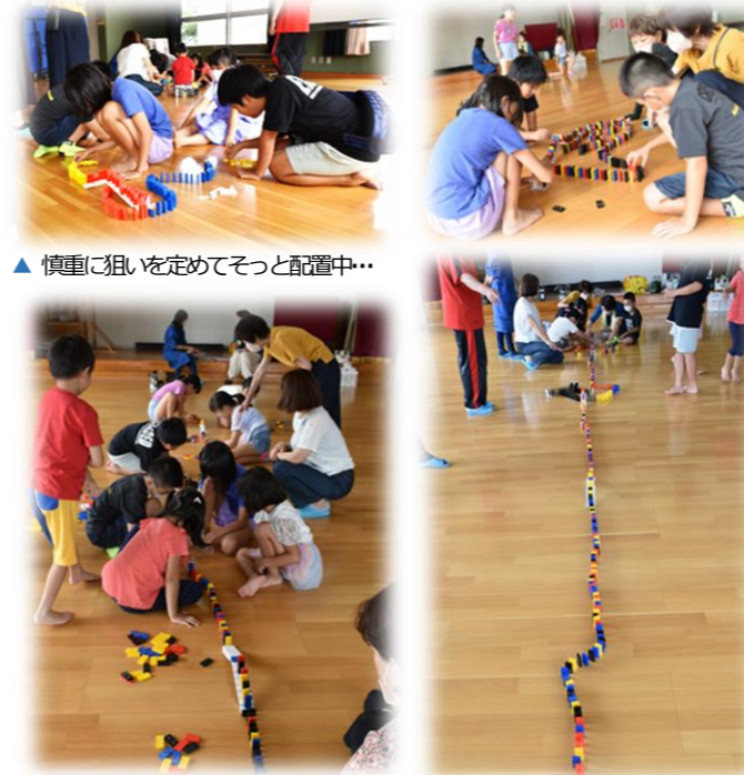
▲慎重に狙いを定めてそっと配置中…