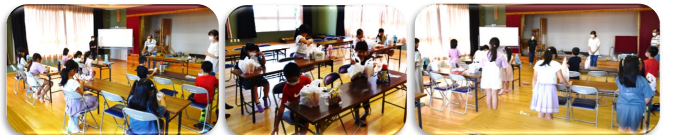
▲なかなかビンゴはないよ〜😊 ▲でも沢山景品はゲットしたよ！😊 ▲最後はしっかり先生にご挨拶「ありがとうございました」😊