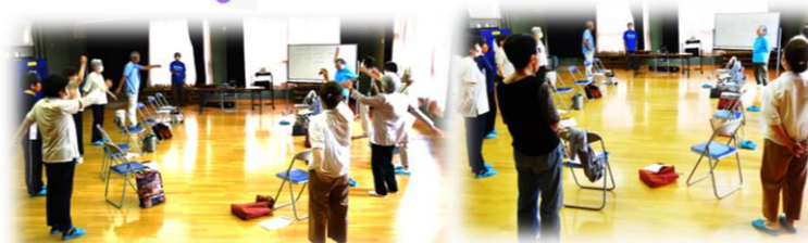
▲声を出す前に軽く準備体操