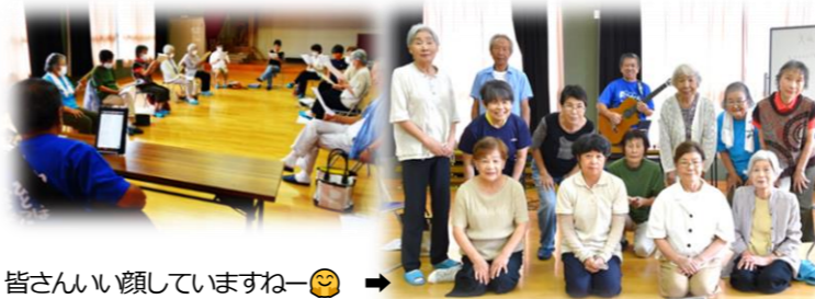
皆さんい顔していますねー😊 ➡

*尚、レディース唱多賀に興味がある人、見学してみたい方がいらっしゃいましたら、多賀公民館までご連絡をお願いします。