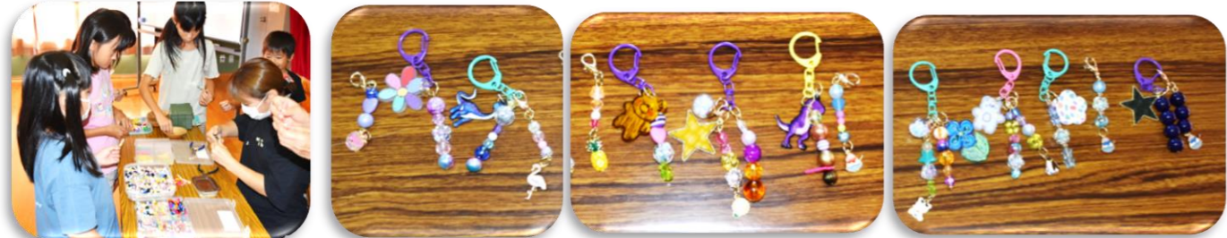
▲ワイヤーとカニカン先生についで頂く。 ▲皆さん素晴らしい作品の出来上がりです。それぞれがセンスしていますね。😊