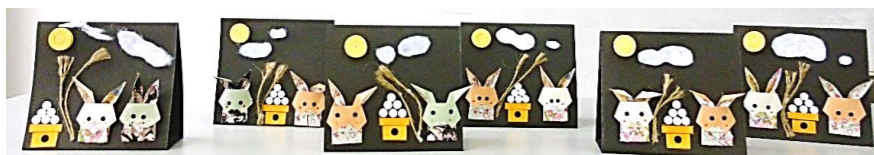
「かがやき広場」(毎月第2金曜開催) 9/8作品

市のホームページから公民館だよりを検索しクリックすれば過去の方も含め、カラーでお楽しみいただけます。サークルや毎月の行事も掲載されています。