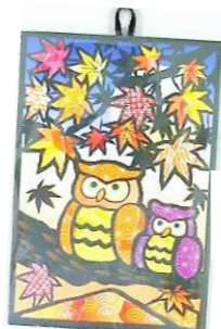
「ふれあい広場」 8/23のちぎり絵

校区の人口(前月比) 人口 3,422人(-9) 男 1,624人(-4) 女 1,798人(-5) 世帯数 1,571戸(+2) R5.8.31現在