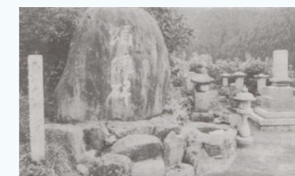
曾我部家の墓と頌徳碑