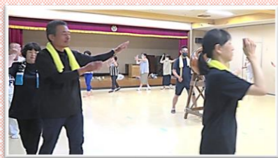
☆暑い中、練習も頑張りました。お疲れ様でした。

4年ぶりの開催にもかかわらず、多くの参加者で賑わいました。人が集まると笑顔の輪が広がり、飯岡の熱いパワーで台風も吹き飛ばす、この盛り上がり!! 誰もが楽しめる夏の風物詩、これからも受け継いでいきたいですね。 ご参加、ご協力いただき、ありがとうございました。