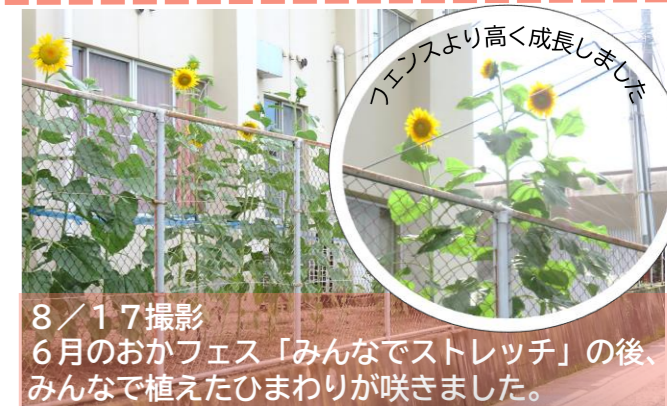
8/17撮影 6月のおかフェス「みんなでストレッチ」の後、みんなで植えたひまわりが咲きました。