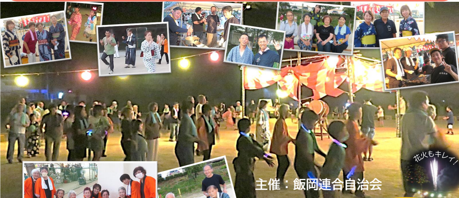
主催：飯岡連合自治会

飯岡校区人口 6,304人 (+9) 男 3,036人 (+4) 〒793-0010 西条市飯岡2171-2 女 3,268人 (+5) TEL:56-2118 FAX:53-9014 世帯数 3,020戸 (+5) E-mail:iioka-k@saijo-city.jp 令和5年7月31日現在 (前月比) 【QRコードから市内の公民館だよりがご覧になれます。】