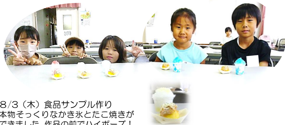
8/3 (木) 食品サンプル作り 本物そっくりなかき氷とたこ焼きができました。作品の前でハイポーズ！