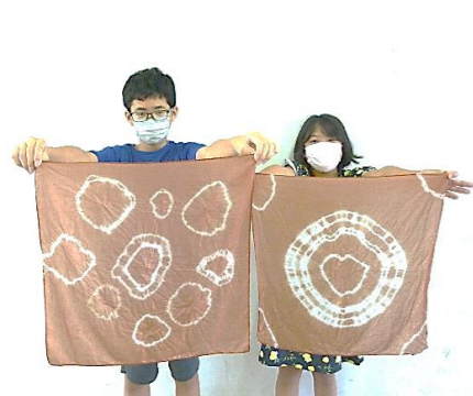
7/27 (木) 草木染め体験