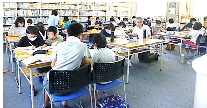
神戸小学校図書室にて行われた公民館主催『地域未来塾』の様子

7/26・27・28の3日間、教員OBによる指導で、主に夏休みの宿題をしました。対象は4・5・6年生でしたが、早めに宿題を済ませようと延べ100名の子ども達が参加しました。今年は神戸っ子オープンカフェも同日開催だったせいか昨年より参加者が多かったようです。