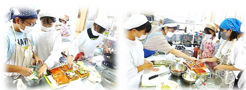
8/4 (金) 朝食づくり かんたんで具材たっぷりのピザトースト。おうちでも作ってみてね！