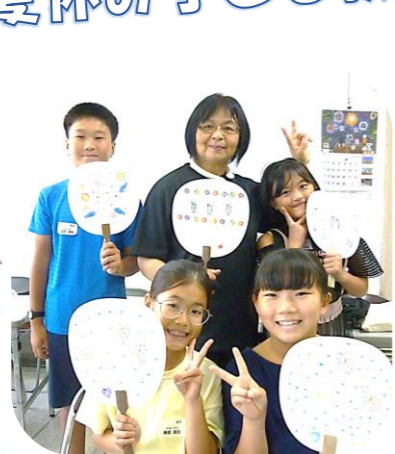
7/28 (金) 消しゴムスタンプ作り