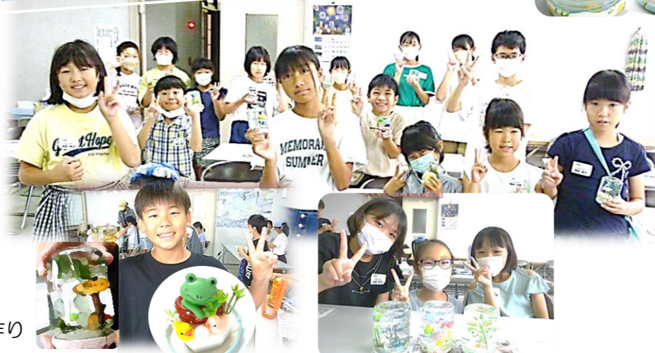
7/29 (土) スノードーム作り