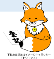
不動産登記推進イメージキャラクター「トウキツネ」

* 中川駐在所だより 公民館で配布しています。8月号は、暴力団追放！「三ない運動+1」の推進 中川駐在所から①還付金詐欺の電話がかかっています。②車上狙いが発生しています。③熱中症に気をつけましょう。 ④夕方の散歩には反射たすきを。⑤「いらぬものはないですか。」等の電話は相手にしないでください。