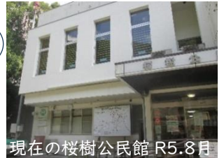
現在の桜樹公民館 R5.8月