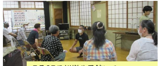
7月27日桜樹公民館にて西条市包括支援センター丹原による「家族介護教室」の様子

【アロマでフットマッサージ】 実生ユズの香りに包まれ、なでるようにマッサージ。それぞれ専門の先生にご指導いただきました。