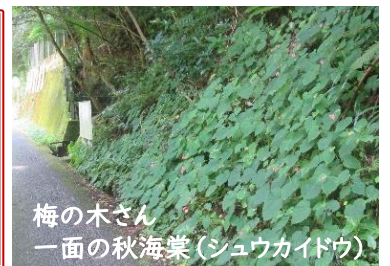
梅の木さん 一面の秋海棠(シュウカイドウ)