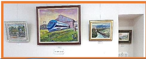
公民館ロビー展【油絵の風景画展】