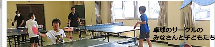
卓球のサークルのみなさんと子どもたち

次のおかフェスのご案内 日時: 9月10日(日) 13:00 ふたりのビッグショーin飯岡 ゲスト: 寺田親良・久門真理子 懐メロをみんなで歌おう♪ 恒例のお楽しみもあります。 ご期待ください!!