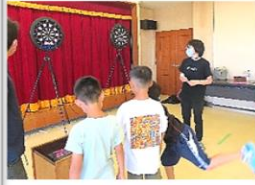
初めてのダーツに大興奮