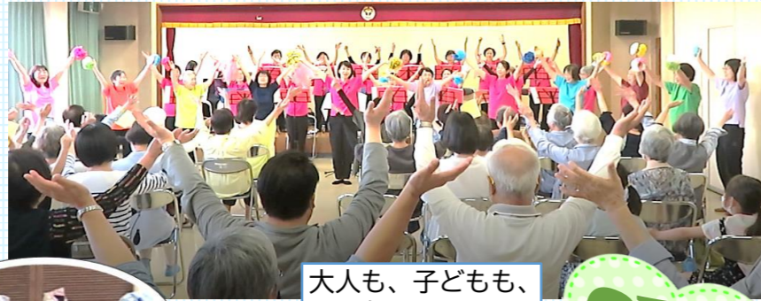
大人も、子どもも、 みんなでY・M・C・A!

楽しいおしゃべりの後は、サークルオカリナのコンサートへ。オカリナの優しい音色に魅了されました。いいおかコーラス有志のみなさんとの「一緒に歌おう♪」コーナーもあり、会場一体となって盛り上がりしました。