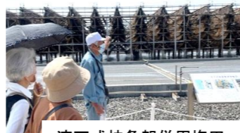
流下式枝条架併用塩田