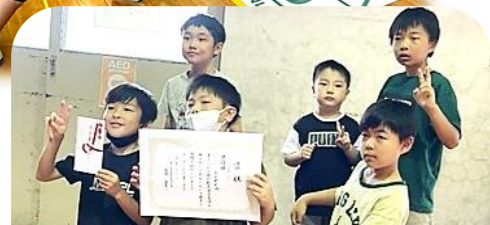
準優勝は小学生チームの2班。 のびのびとプレーし、よく頑張りました。

連合自治会主催のシャフルボード大会が神戸小学校体育館で行われました。総勢70名の参加で、『病みつきになるくらい楽しかった!』と感想をいただきました。準備や片付けの役員さん、審判のスポーツ推進員さん、お疲れさまでした。