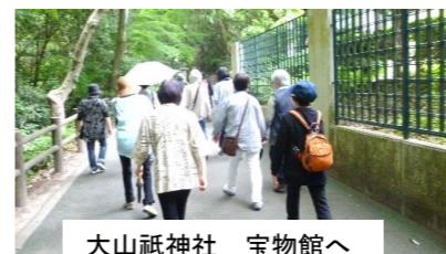
大山祇神社 宝物館へ