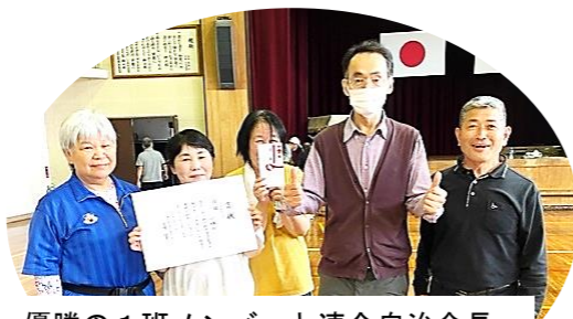
優勝の1班メンバーと連合自治会長。未経験者2名を含む当日結成されたチームでしたが、生まれ持ったの才能を開花させたようです!