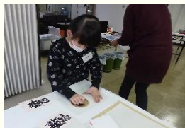
納得がいくまで何枚も刷りました。