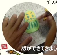
版ができてきました