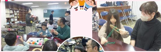
ドーナツ状のダンボールに