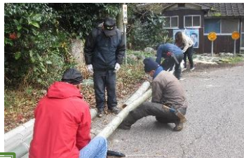
伐り出した竹の長さを調整