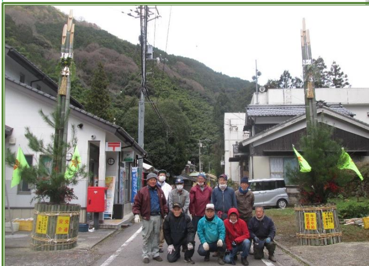
無事に完成! 寒い中おつかれさまでした。令和5.12.17