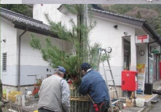
こんなもんでかまんかいの…