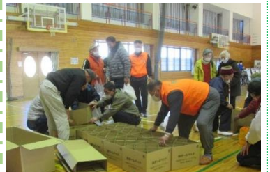
段ボールベッドを作っています。 (12/10 丹原西中体育館)