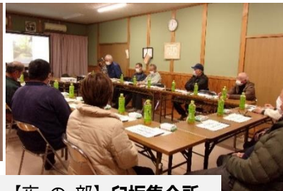
【夜の部】白坂集会所