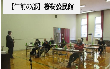
【午前の部】桜樹公民館