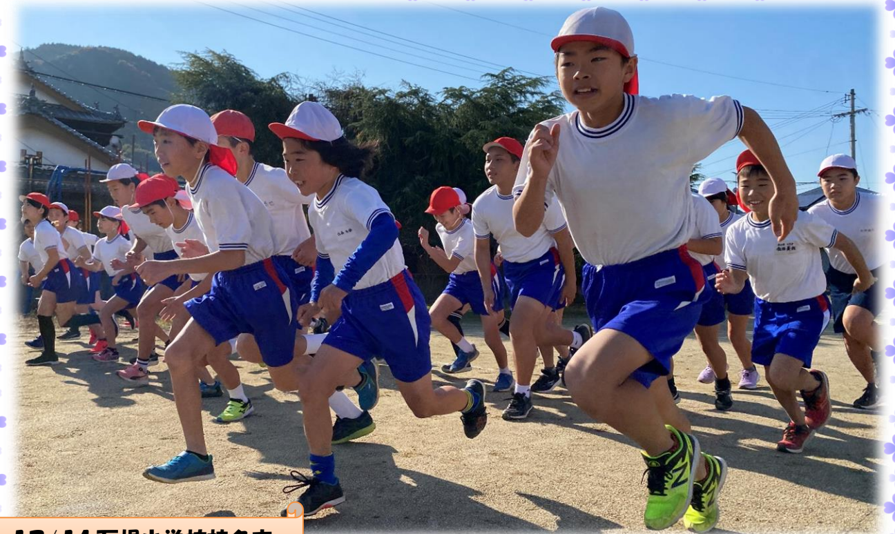
12/14 石根小学校持久走

青空の下、今年も持久走大会が開催されました。たくさんの方の応援を受け、子供たちは一生懸命走っていました。