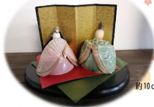
約10cm程度の大きさです