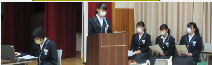
11月7日(火)下町・久妙寺