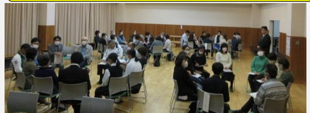
11月9日(木)今井・願連寺

お忙しい中、多くの地域住民の方々や小・中学校の先生方、丹原東中学校の生徒さんにご参加いただき、本当にありがとうございました。