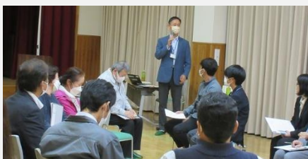
11月1日(水)上町地区・池田

今後も市民一人ひとりが、人権・同和教育問題を正しく認識し、問題の解決を自らの課題として受け止め、積極的に取り組み、明るく住みよいまちづくりを目指すために、一緒に学んでいきましょう。