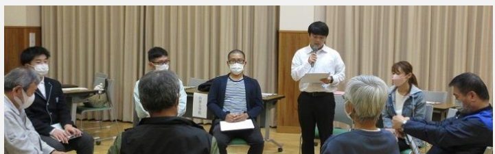
11月2日(木)北田野区東・田野上方区東