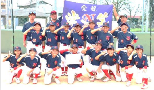
※中川スポーツ少年団は、丹原小学校と中川小学校の児童で結成されています。