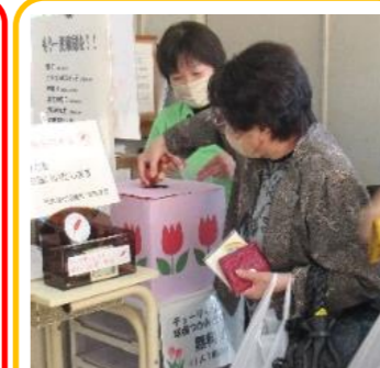
チューリップ球根つかみどり