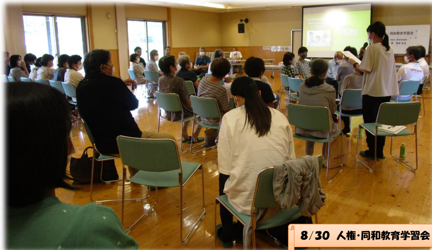
8/30 人権・同和教育学習会