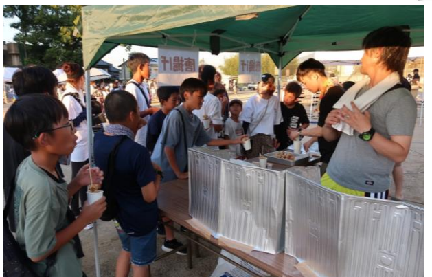
青年団による屋台也大盛況！