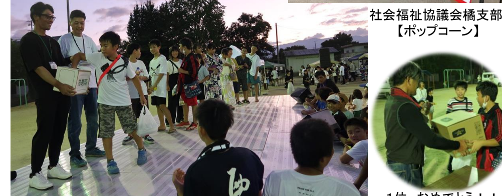
【お楽しみ抽選会】わくわくドキドキ、6年生が抽選しました。