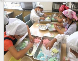
8/2 お茶とマナーの教室