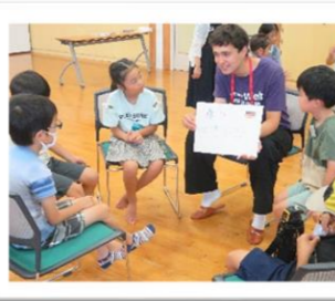
ドイツ、フランス、オーストリア、ハンガリー、アメリカからの高校留学生と楽しく交流しました。各国のじゃんけん遊びやだるまさんがころんだで盛り上がりました★