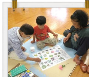
8/4～6 おはなしのクラフト広場 今回のテーマは「牧野富太郎」。 草花のすごろくで遊んだよ♪