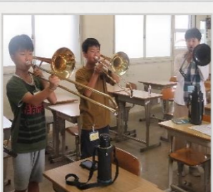
「音を楽しむ」 器楽に触れる楽しさを知ったよ。