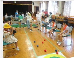
7/25 西条わくわく教室