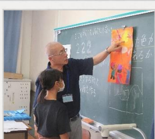
「めざせ！ゴッホ」 夏休みの応募作品に挑戦！