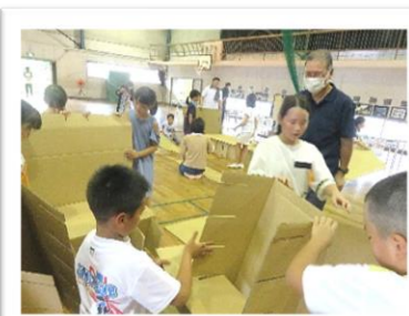
8/5 学校の怪談で防災ベッドの組み立てに挑戦しました。寝心地はどうか？

西条校区連合自治会 水質保全区域 河川一斉清掃 9月10日(日) 8:00～9:30 〈小雨決行 雨天中止〉