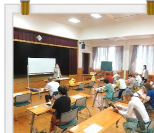
8/3 西条おとな学級 スマホ基礎④ カメラ スマホのカメラで撮った写真を お友だちと共有してみよう。