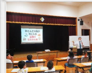
8/2 金融教室(児童ク対象)