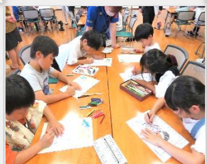
7/27 めりえ(児童ク対象)