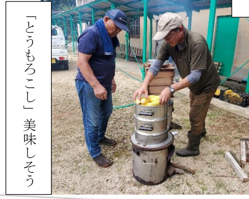
マルシェ前の準備風景 8/4