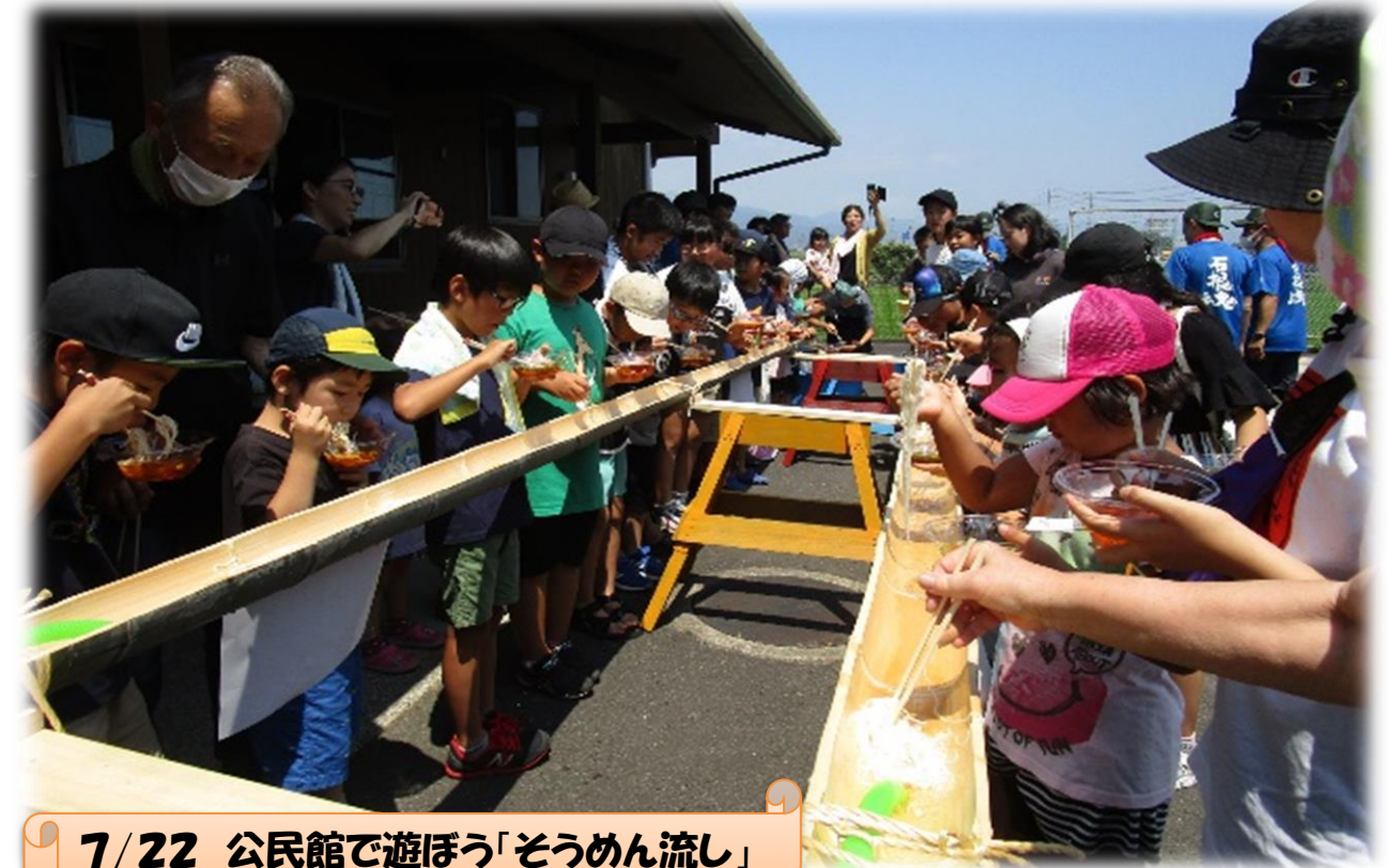
7/22 公民館で遊ぼう「そうめん流し」