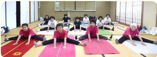
全身を動かし、ストレス解消!! 体操のおかげで、毎日元気で笑顔のみなさん

会員募集中!! 身体も心も健康でいたい方、ぜひ見学にお越しください。お待ちしております。