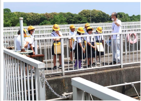
【西条浄化センター】