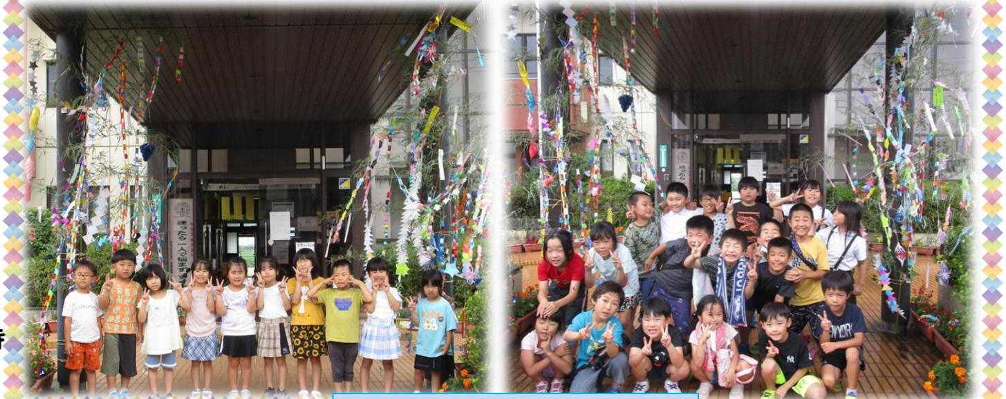
7月7日 石根公民館【七夕飾り】

今年も石根保育所と石根小学校の児童クラブの皆さんに七夕の飾りつけをお願いしました。たくさんの願い事を書いてくれました。ありがとうございました。