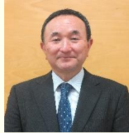
一般社団法人コムスクスひめ副代表理事 元愛媛大学教職大学院特定教授