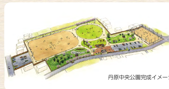
丹原中央公園完成イメージ